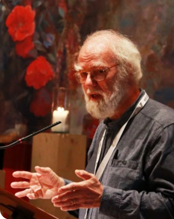
Damit die Welt sie selbst sein kann: Rowan Williams.