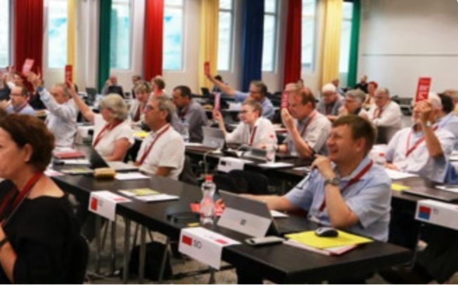
Die Synodalen in Olten.

Sukkurs. Er befand, der Rat sei zu schnell unterwegs. Man habe ein Ruderboot bestellt und einen Tanker bekommen. Die Arbeit in den Spitälern sei anspruchsvoll. Die Probleme gelte es vor Ort zu lösen. Spitalpfarrer/-innen könnten sich am Bett des Patienten doch nicht als Mitarbeitende von spiritual care vorstellen. – Das Postulat wurde abgeschrieben.